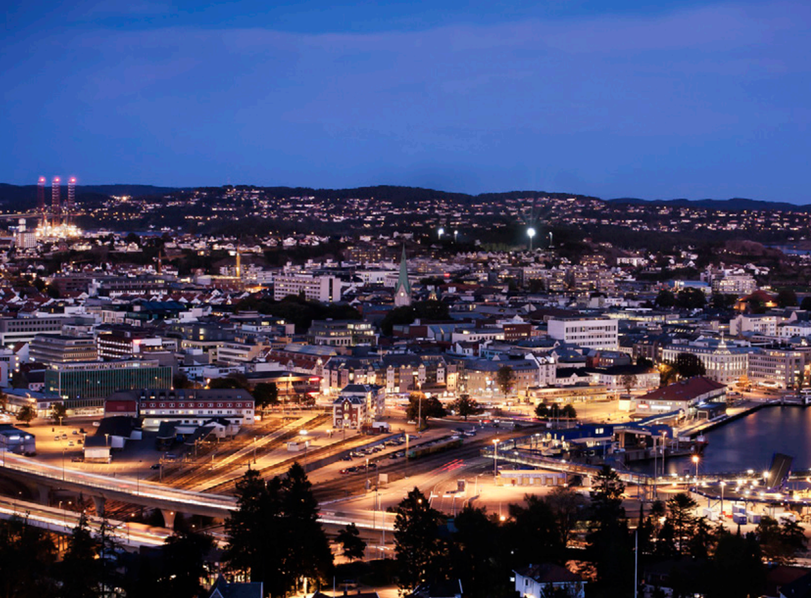
Nye Veier AS har fått hovedkontor i Kristiansand.

testsentre som er satt i system og får, ved hjelp av statlige midler, komplettert sine fasiliteter med utstyr. Katapultordningen skal sikre at kompetanse deles på tvers av næringer og regioner, og at næring og utdanning kobles enda tettere.