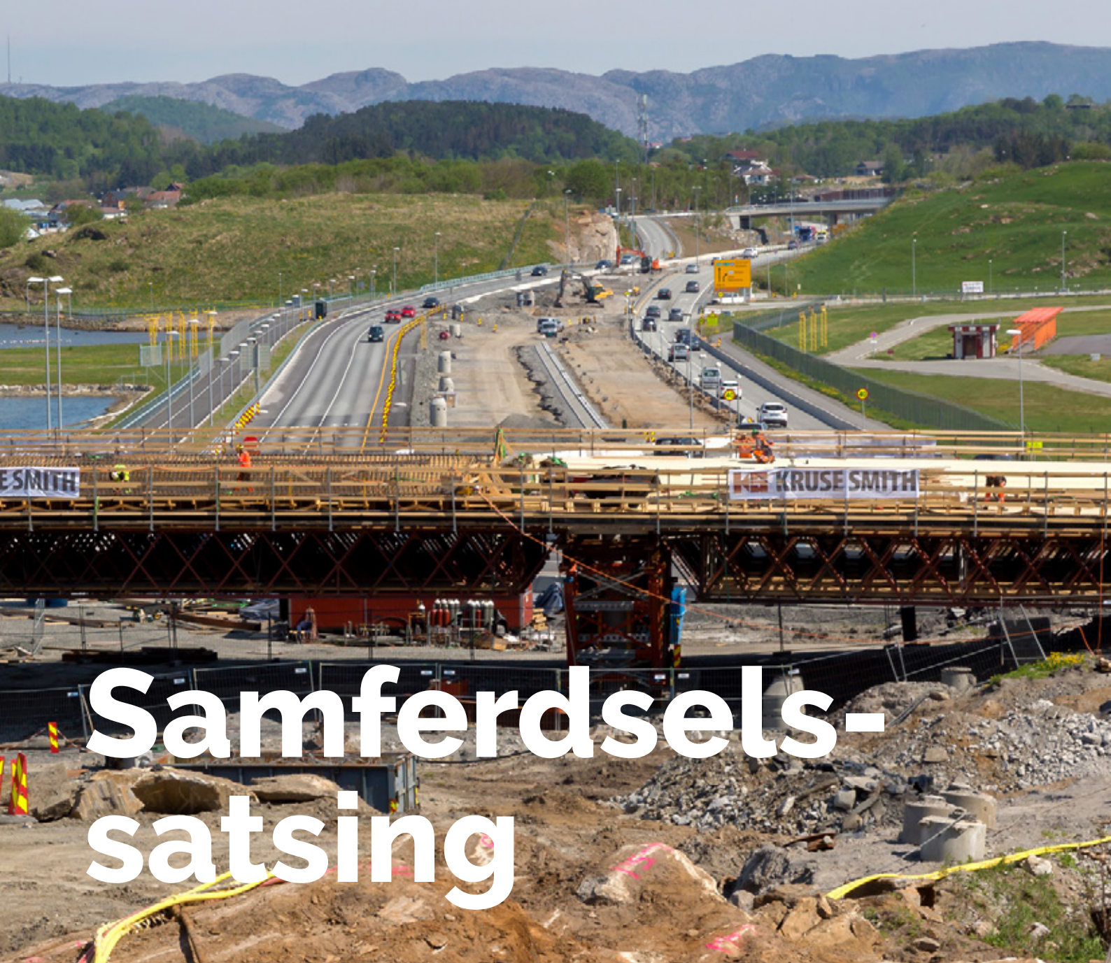
Byggeprosjekt i Rogaland.