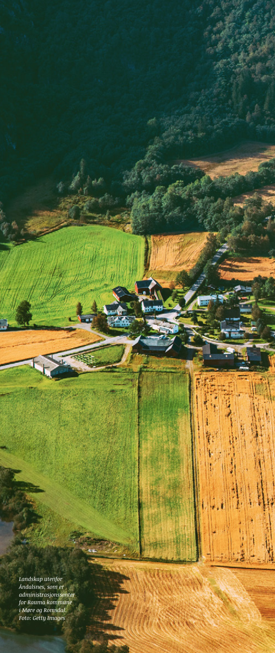
Landskap utenfor Åndalsnes, som er administrasjonssenter for Rauma kommune i Møre og Romsdal.